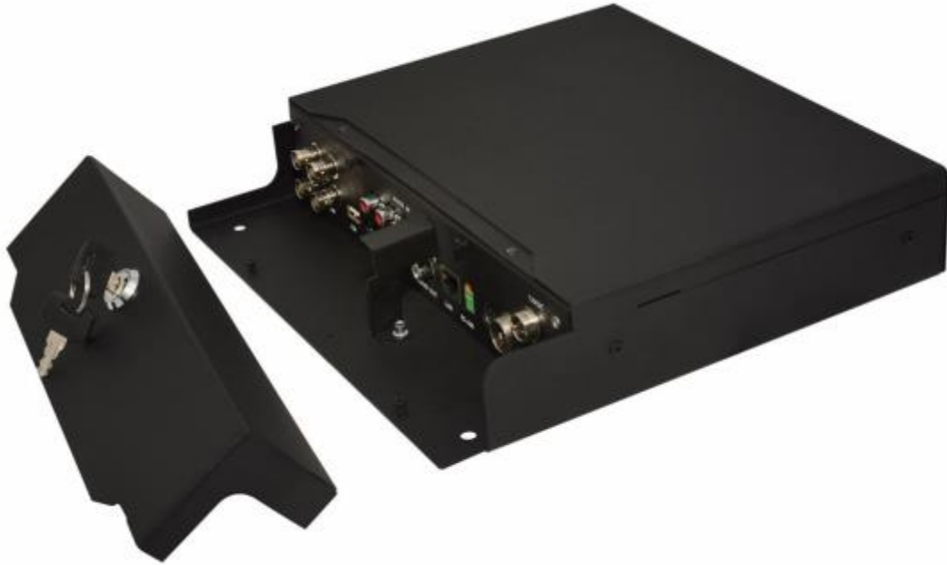
Рис. 1.1. Внешний вид