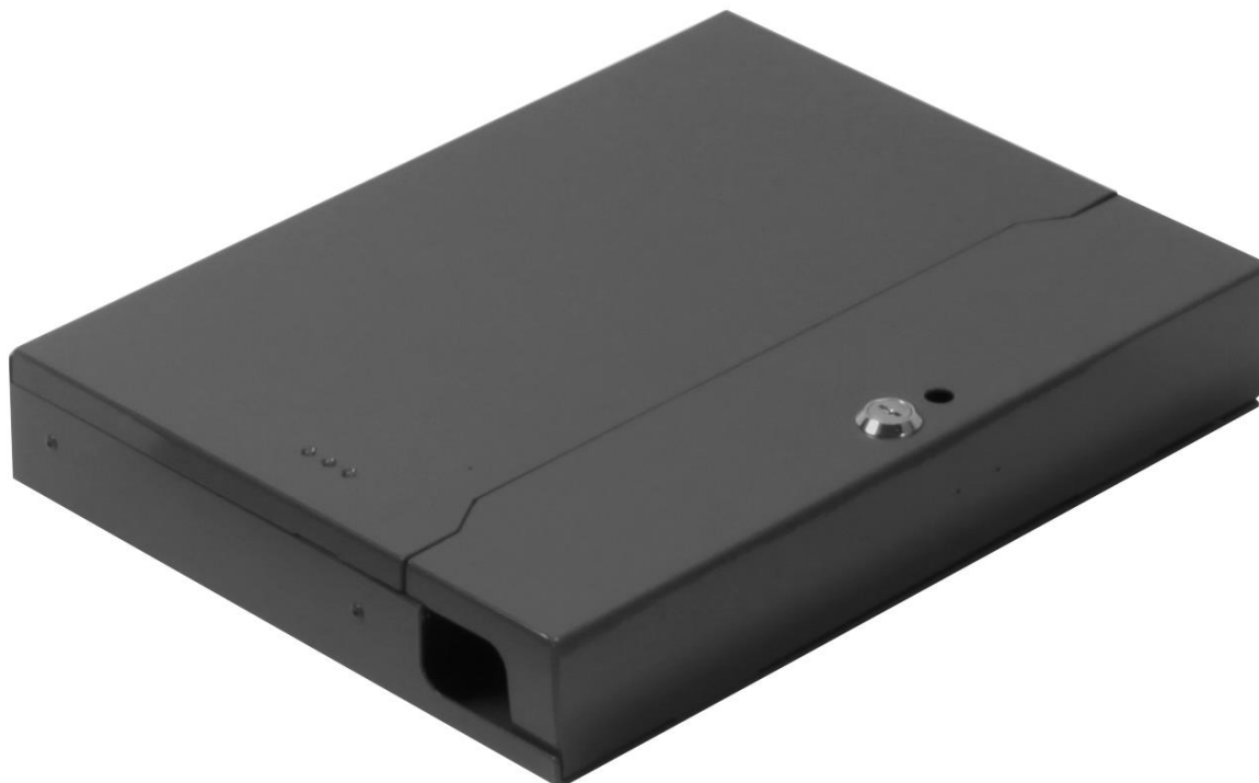
Рис. 1.1. Внешний вид